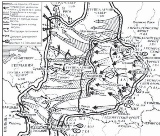
Белорусская стратегическая операция 1944 г.