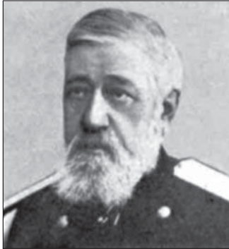
Генерал от инфантерии Г.А. Леер (1829 — 1904), автор шести изданий «Стратегии»

о оборонительная операция», при этом стратегической обороне он посвятил многие страницы своего труда «Оборонительная война» 6 . В нём излагались взгляды на организацию военных действий в оборонительной войне (которую, по мнению автора, вести легче, чем наступательную), но ни дефиниции, ни плана собственно стратегически-оборонительной операции учёный не предложил. В 17-м томе «Военной энциклопедии» издания И.Д. Сытина (1914) в статье «Операция» было дано следующее определение этого понятия: «совокупность стратегических и тактических действий, направленных к достижению какой-либо частной задачи данной войны и завершаемых обыкновенно крупным боевым столкновением сторон» 7 . Далее: «План операции должен слагаться из установления её цели, выяснения ближайшей задачи на пути к достижению этой цели и способа решения её...» Это был шаг вперёд в сравнении с точкой зрения Леера — Михневича, но не очень большой: далее вовсе не затрагивались вопросы о том, кто и как планирует и организует операцию, какими конкретно силами она проводится. В условиях, когда только складывалось понимание операции как формы боевых действий армий (армейской операции), а фронтовые объединения ещё только зарождались, стратегия была не в состоянии разграничить понятия «операция» и «стратегическая операция», сформулировать критерии стратегической операции.