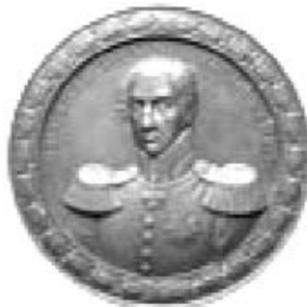
Памятная медаль в честь М. П. Бахтина