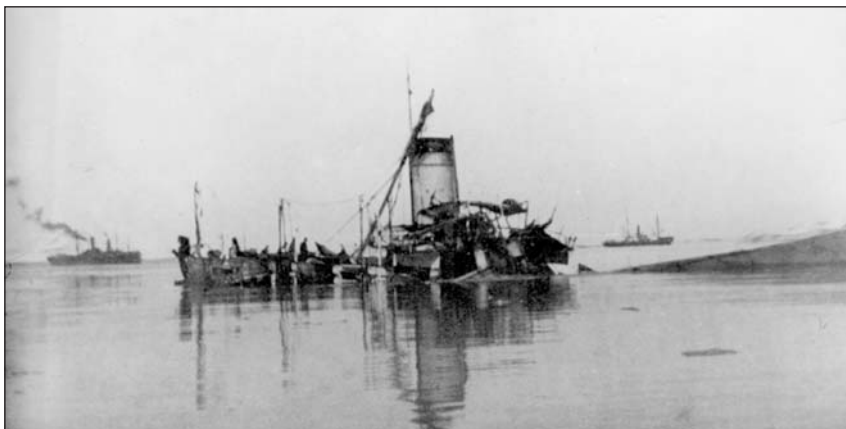
Взрыв «Корейца» (вверху) и «Кореец» после взрыва

ец» капитан 2-го ранга Беляев в 9 ч 45 мин утра объявил офицерам корабля о начале войны и совместном с капитаном 1-го ранга Рудневым решении — попытаться прорваться сквозь линию японских судов, подготовив лодку к бою. Для этого было выброшено за борт все лишнее дерево (помимо механической установки на лодке имелось парусное вооружение), убран весь лишний такелаж и все, что могло способствовать распространению огня. Машину защитили от осколков колосниками, а выше — сетками из дюймового стального троса, положив еще на эти сетки медные решетки, снятые с выброшенных за борт светлых люков. Были осмотрены и задраены все водонепроницаемые двери, горловины и люки, изготовлен пластырь и опробованы все имеющиеся противопожарные средства (в бою палуба постоянно поливалась водой). «В предвидении рокового исхода предстоящего боя капитан 2-го ранга Беляев в присутствии комиссии из офицеров лодки сжег все секретные карты, приказы и