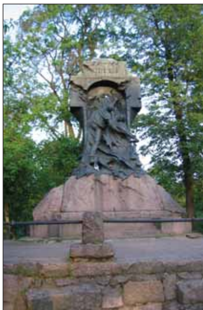
Памятник миноносцу «Стерегущий» в наши дни

Имя миноносца «Стерегущий» унаследовало несколько кораблей отечественного флота. Это уже упомянутый миноносец постройки 1906 г. и эсминец пр. 7, построенный в 1939 г., а затем большой противолодочный корабль пр. 61 Краснознаменного Тихоокеанского флота. Вскоре после русско-японской войны в Сибирской флотилии появилось два эскадренных миноносца, наименованных в честь офицеров «Стерегущего»: «Лейтенант Сергеев» и «Инженер-механик Анастасов». В честь легендарного миноносца в 1948 г. названо село — Стерегущее (на Крымском полуострове). В 1962 г. ученые-гидрографы присвоили имя Стерегущий острову в море Лаптевых. Имя командира миноносца «Стерегущий» присвоено сегодня одной из улиц на его родине в Курске. Там фамилия Сергеевых бы-