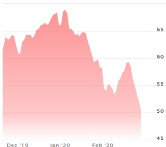
Рисунок 2 – падение цены на нефть марки Brent под влиянием новостей о вспышке коронавируса [15]

И восстановления цен к прежним уровням в ближайшее время не предвидится: напротив, аналитики «Citigroup Inc.» существенно снизили свои прогнозы по ценам на нефть в связи со вспышкой вируса (см. таблицу 1). и допускают падение цены до 47$/баррель в ближайшей перспективе, что станет самым низким уровнем за последние 2,5 года. [17]