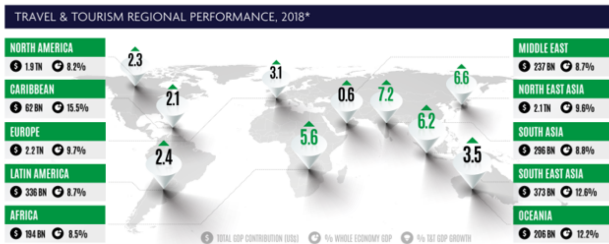
Рисунок 1 – региональная структура мирового туризма, 2018 г. [23]

Под большим давлением находится и рынок нефти. В Китае, который является крупнейшим импортером нефти на мировом рынке, потребление сократилось приблизительно на 20% [17] или 3 млн. баррелей в день. Для понимания масштабов – это 60% от всего объема нефтяного экспорта России [11].